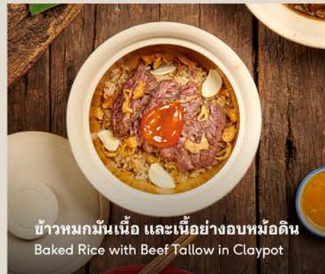
ข้าวหมกมันเนื้อ และเนื้อย่างอบหม้อดิน Baked Rice with Beef Tallow in Claypot