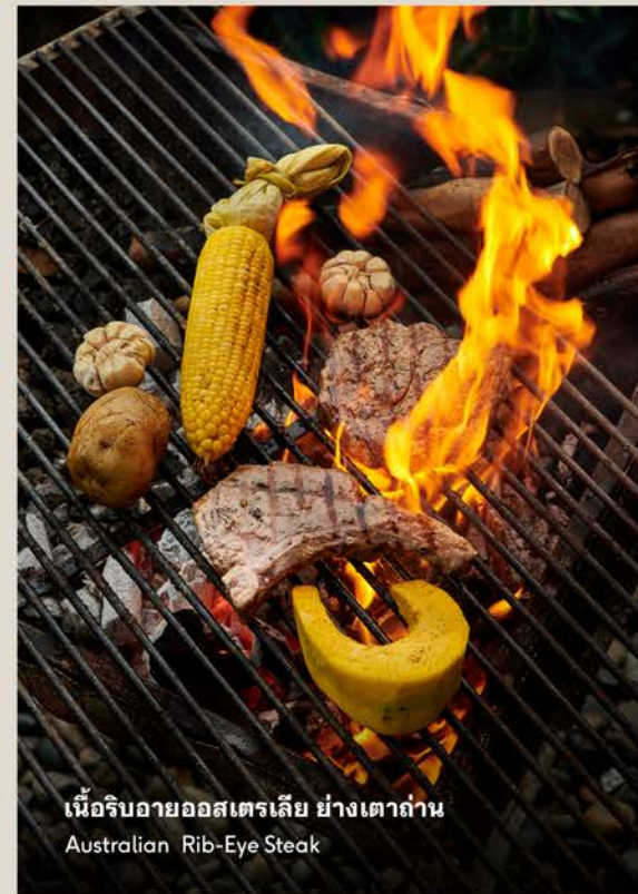
เนื้อริบอายออสเตรเลียย่างเตาถ่าน Australian Rib-Eye Steak