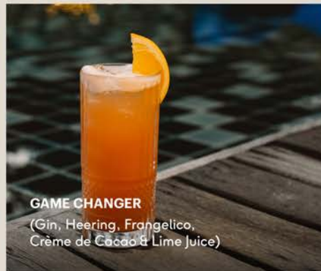
GAME CHANGER (Gin, Heering, Frangelico, Crème de Cacao & Lime Juice)