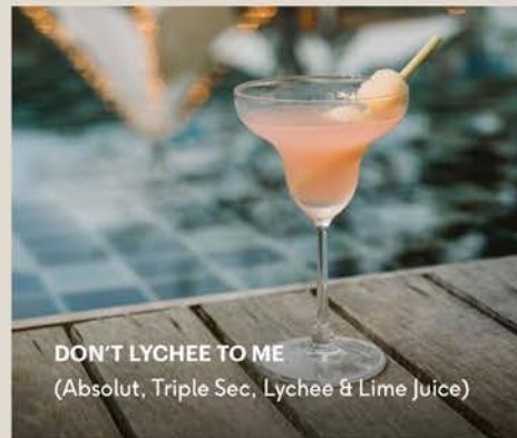
DON'T LYCHEE TO ME (Absolut, Triple Sec, Lychee & Lime Juice)