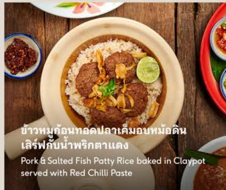
ข้าวหมูก้อนทอดปลาเค็มอบหม้อดิน เสิร์ฟกับน้ำพริกตาแดง Pork & Salted Fish Patty Rice baked in Claypot served with Red Chilli Paste