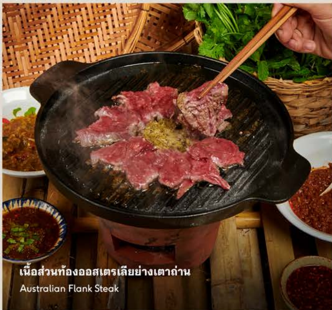
เนื้อส่วนท้องออสเตรเลียย่างเตาถ่าน Australian Flank Steak