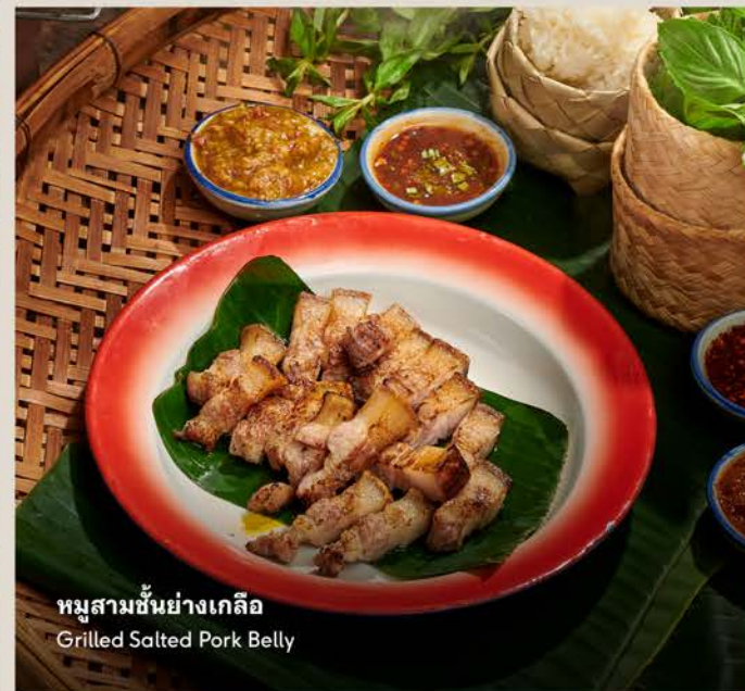
หมูสามชั้นย่างเกลือ Grilled Salted Pork Belly