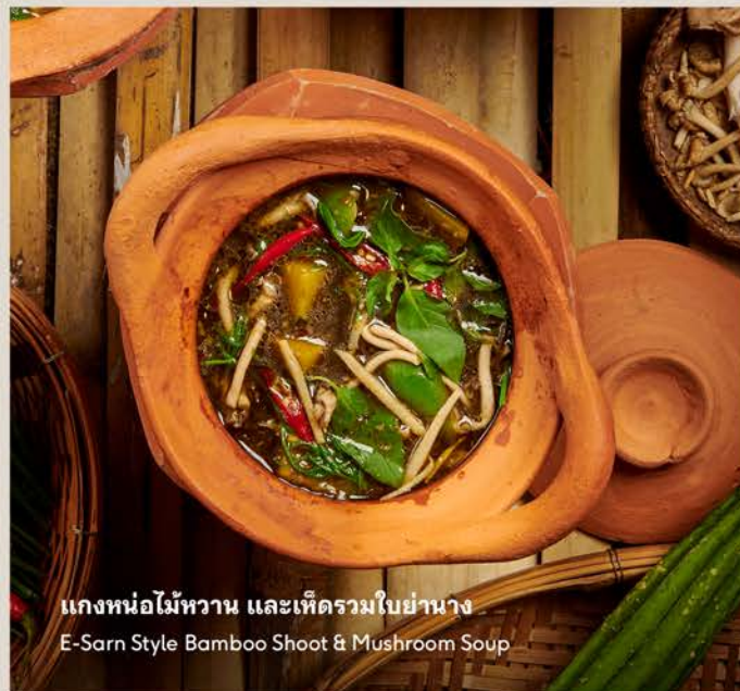
แกงหน่อไม้หวาน และเห็ดรวมใบย่านาง E-Sarn Style Bamboo Shoot & Mushroom Soup