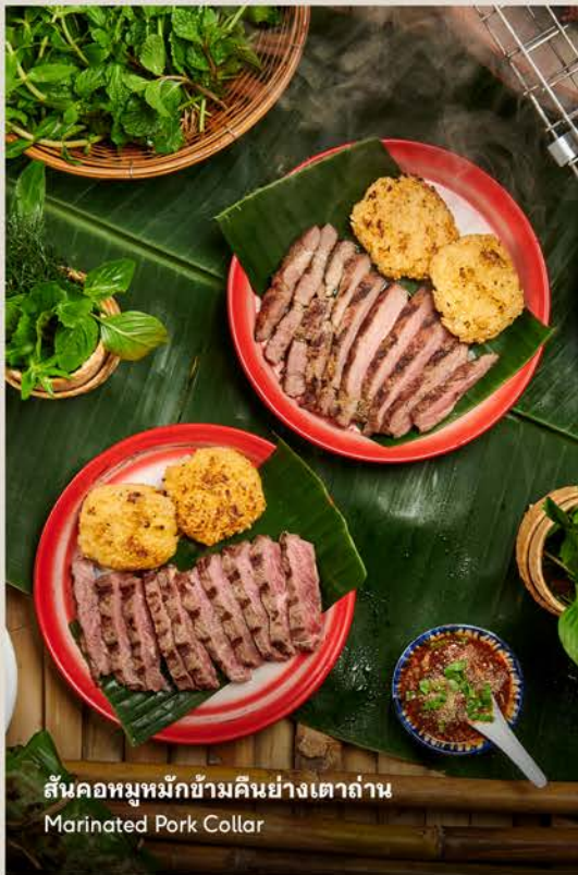
สันคอหมูหมักข้ามคืนย่างเตาถ่าน Marinated Pork Collar